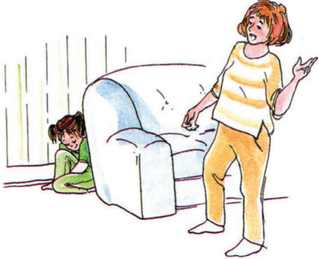
လင်းဆေးသည် သူ့ကိုယ်ခန္ဓာပေါ်တွင် ဖိထားသည့် ခံစားမှုကို နှစ်သက်သည်။