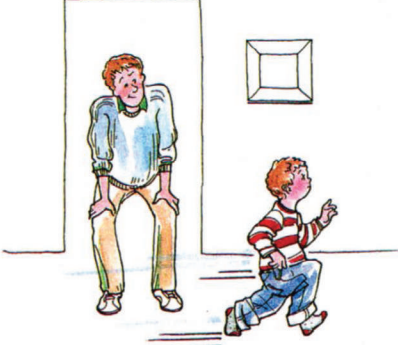
ဘင်သည်အိမ်အနံ့ပြေးလွှာခြင်းဖြင့် လှုပ်ရှားမှုကို ရှာကြံသည်။